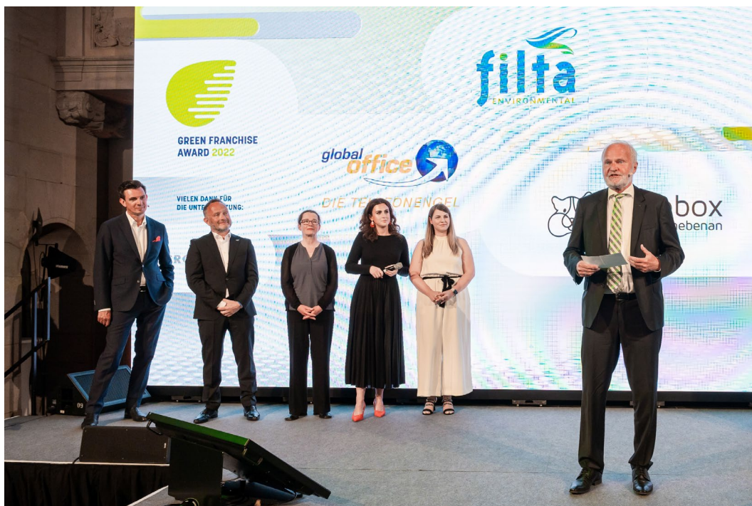
Bildtitel: Zeremonie beim Green Franchise Award des Deutschen Franchiseverbandes Mai 2022

Nominierung durch nachhaltige Unternehmensführung mit ökologischem und sozialem Fokus